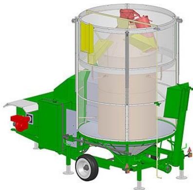
Рис.3 – Сушарка AGRIMEC серії AS (Італія)

використання комбайнів, переміщаючи їх з півдня на північ. Адже на первинну обробку і зберігання зібраного зерна приходиться більше 25 % від загальних витрат на його виробництво. Тому використання порівняно недорогих пересувних зерносушарок, здатних працювати в будь-якому місці за будь-яких погодних умов - це реальний шлях підвищення ефективності виробництва зернових, бобових і олійних культур [9,10].