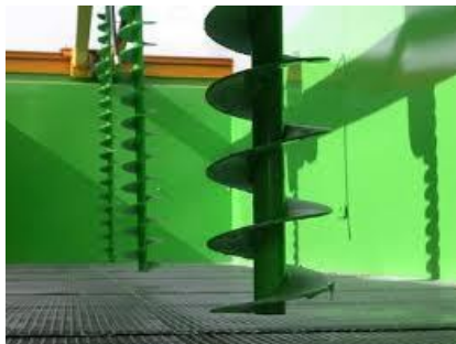
Рис.4 – Шнекові перемішувачі шару зерна у сушарці TURBODAN TD-15

Зважаючи на отримані експериментальні результати та аналізуючи досвід лідерів ринку сушарок можна запропонувати встановлювати систему механічних перемішувачів і розпушувачів шару зернового матеріалу у сушильну камеру сушарки. Така система являє собою вертикально розміщені шнекові робочі органи, які перемішують шар зерна почергово піднімаючи його та опускаючи (рис.5).