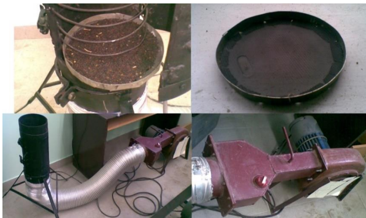
Рис. 1 – Установка для дослідження процесу сушіння насіння ріпаку

Для сушіння у касети засипалися проби матеріалу з відомою початковою вологістю і масою.